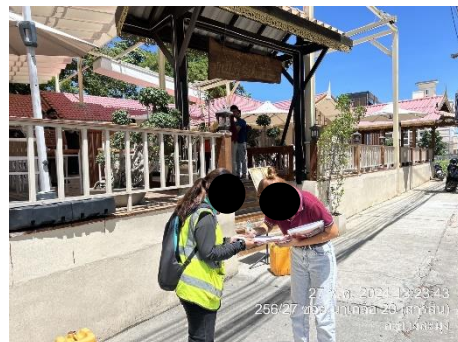
รูปที่ 38 การประสานงานแจ้งผลการสำรวจอาคารข้างเคียง