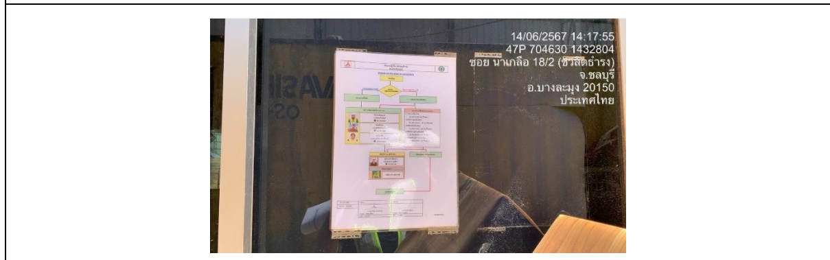
รูปที่ 41 ขั้นตอนปฏิบัติกรณีเหตุฉุกเฉิน