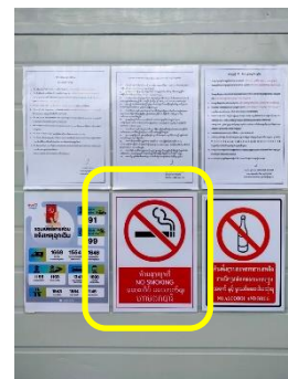
รูปที่ 29 ป้ายห้ามสูบบุหรี่