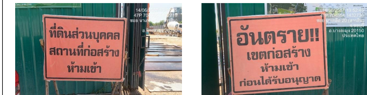
รูปที่ 2 ป้าย “เขตก่อสร้าง”