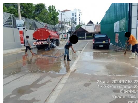
รูปที่ 8 เจ้าหน้าที่ทำความสะอาดถนน