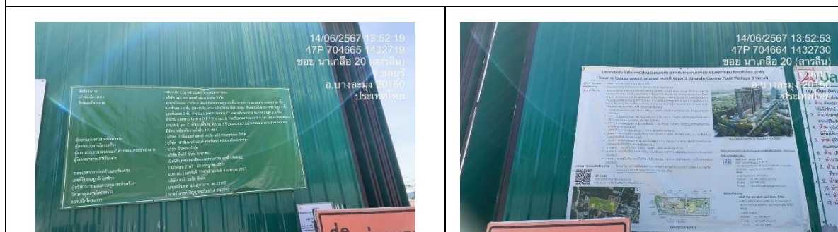
รูปที่ 3 ป้ายรายละเอียดโครงการ