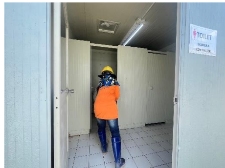
รูปที่ 24 พนักงานทำความสะอาดห้องน้ำ