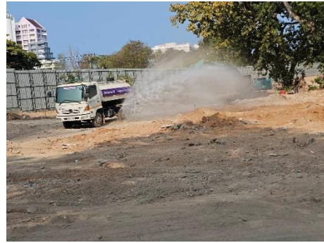
รูปที่ 13 รถบรรทุกน้ำฉีดพ่นบริเวณพื้นที่ก่อสร้าง