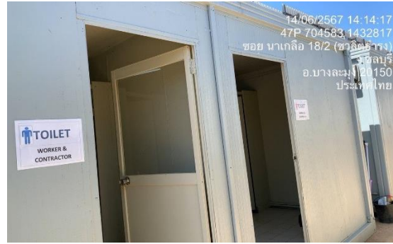
รูปที่ 23 ห้องน้ำ บริเวณพื้นที่ก่อสร้าง