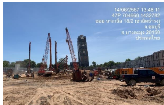
รูปที่ 16 เสาค้ำเข็มเจาะ