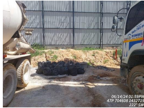
รูปที่ 26 (ต่อ) การรวบรวมขยะ