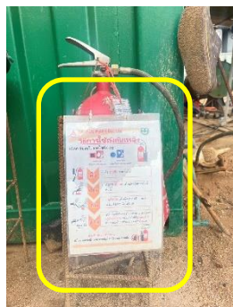
รูปที่ 28 ป้ายแนะนำการใช้ถังดับเพลิงมือถือ