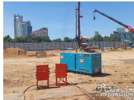
รูปที่ 11 อุปกรณ์ที่ใช้ในโครงการ