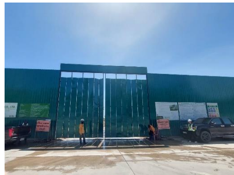
รูปที่ 14 ประตูโครงการปิดทึบ