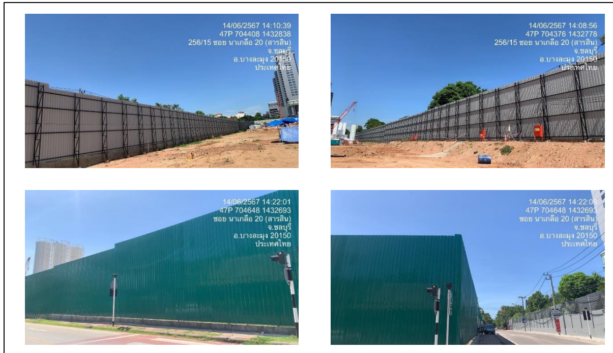
รูปที่ 1 ติดตั้งรั้ว Metal Sheet รอบพื้นที่โครงการ