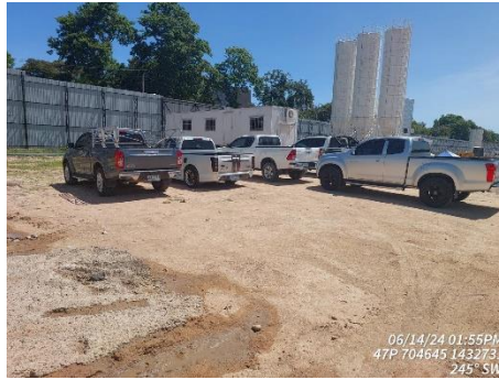
รูปที่ 35 พื้นที่จอดรถ