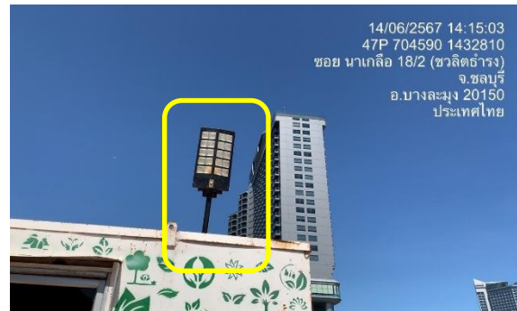
รูปที่ 36 ไฟฟ้าส่องสว่าง