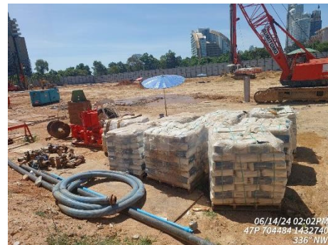
รูปที่ 7 ผ้าใบปิดคลุมวัสดุก่อสร้าง