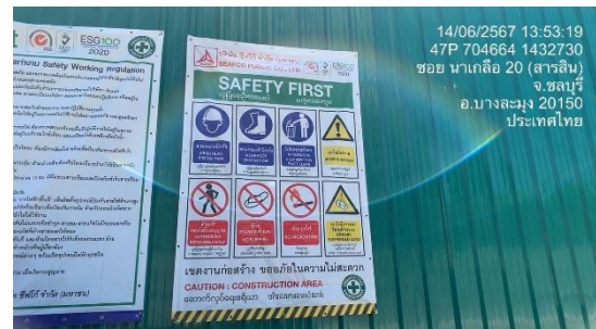
รูปที่ 12 ป้ายกฎระเบียบภายในพื้นที่โครงการ