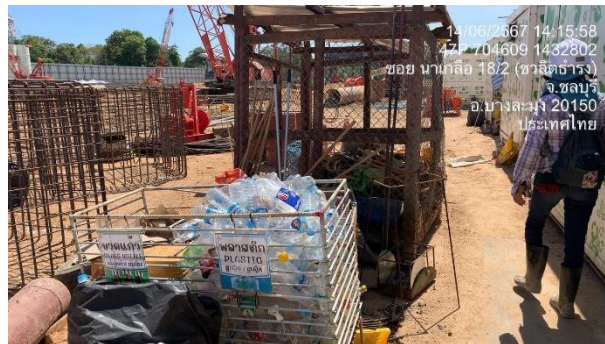
รูปที่ 25 พื้นที่คัดแยกขยะ