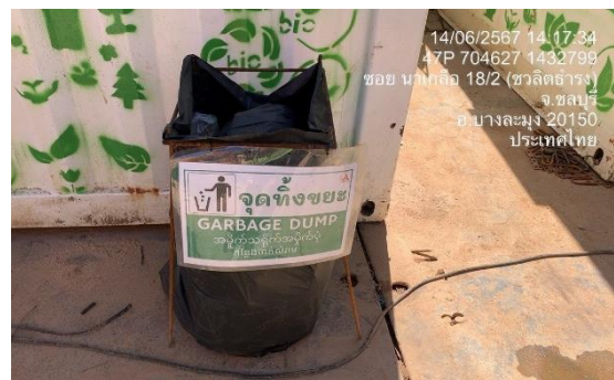
รูปที่ 26 การรวบรวมขยะ