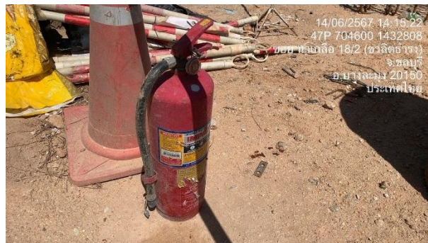
รูปที่ 27 ถังดับเพลิงมือถือ