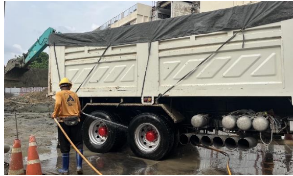
รูปที่ 9 การใช้ผ้าใบปิดคลุมรถบรรทุก