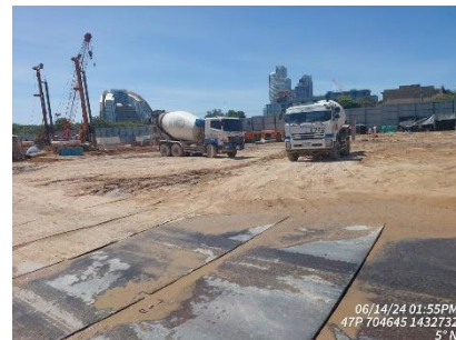
รูปที่ 15 แผ่นเหล็กบริเวณพื้นที่ก่อสร้าง