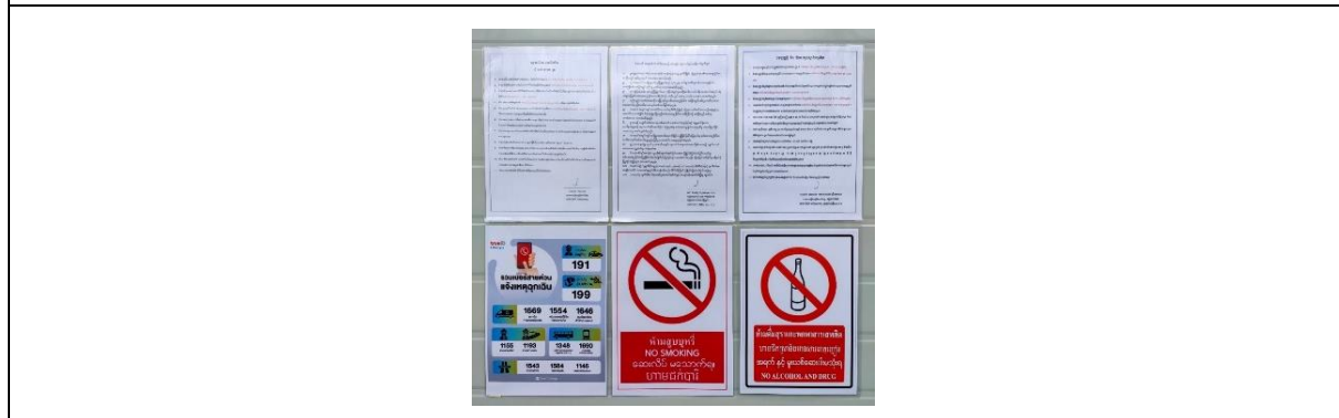
รูปที่ 40 ป้ายกฎระเบียบบ้านพักคนงาน